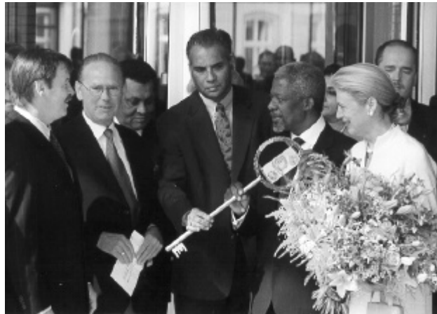
Remise des clés du bâtiment

HAMBOURG. La cérémonie d'inauguration du nouveau bâtiment du Tribunal à Nienstedten, Hambourg, a eu lieu le lundi 3 juillet 2000. La cérémonie a été organisée conjointement par le Tribunal international du droit de la mer, le Gouvernement de la République fédérale d'Allemagne et le Sénat de la Ville libre et hanséatique de Hambourg. Elle a eu lieu en présence du Secrétaire général des Nations Unies, son Excellence M. Kofi Annan. Le bâtiment a été conçu et construit pour le Tribunal par le pays hôte, la République fédérale d'Allemagne et la ville d'accueil, la Ville libre et hanséatique de Hambourg.