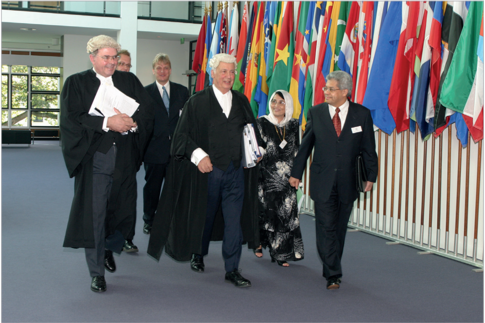
Affaire relative aux travaux de poldérisation par Singapour à l'intérieur et à proximité du détroit de Johor (Malaisie c. Singapour), mesures conservatoires