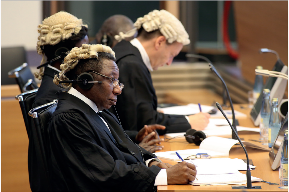
Affaire de l'« ARA Libertad » (Argentine c. Ghana), mesures conservatoires