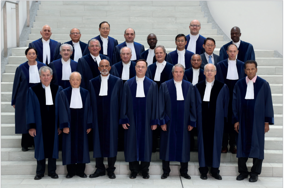
Les 21 juges du Tribunal, le Greffier et le Greffier adjoint.