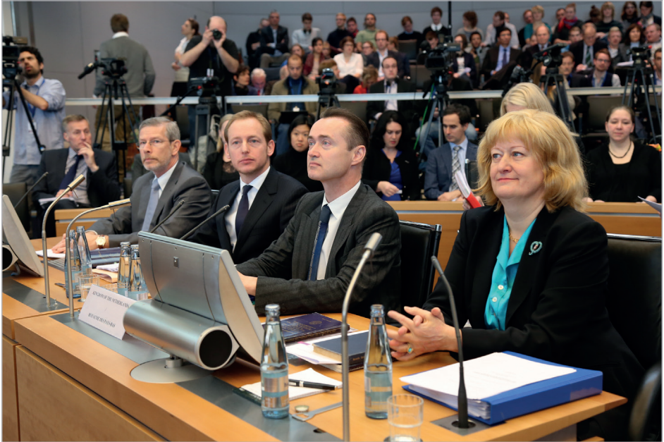
Affaire de l'« Arctic Sunrise » (Royaume des Pays-Bas c. Fédération de Russie), mesures conservatoires