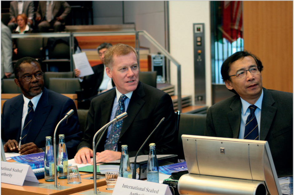
Responsabilités et obligations des Etats qui patronnent des personnes et des entités dans le cadre d'activités menées dans la Zone (Demande d'avis consultatif soumise à la Chambre pour le règlement des différends relatifs aux fonds marins)