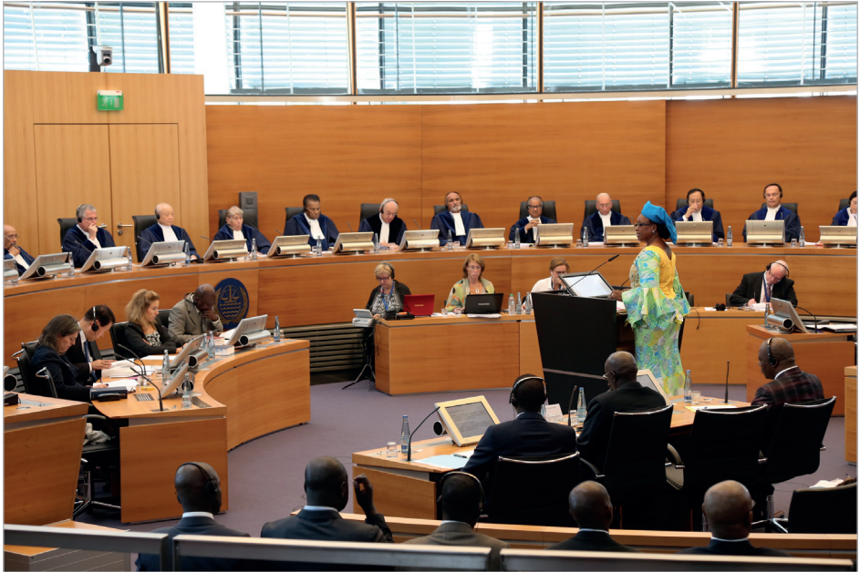
Demande d'avis consultatif soumise par la Commission Sous-Régionale des pêches (CSRFP) (Demande d'avis consultatif soumise su Tribunal)