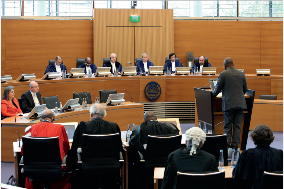
Différend relatif à la délimitation de la frontière maritime entre le Ghana et la Côte d'Ivoire dans l'océan Atlantique (Ghana/Côte d'Ivoire)