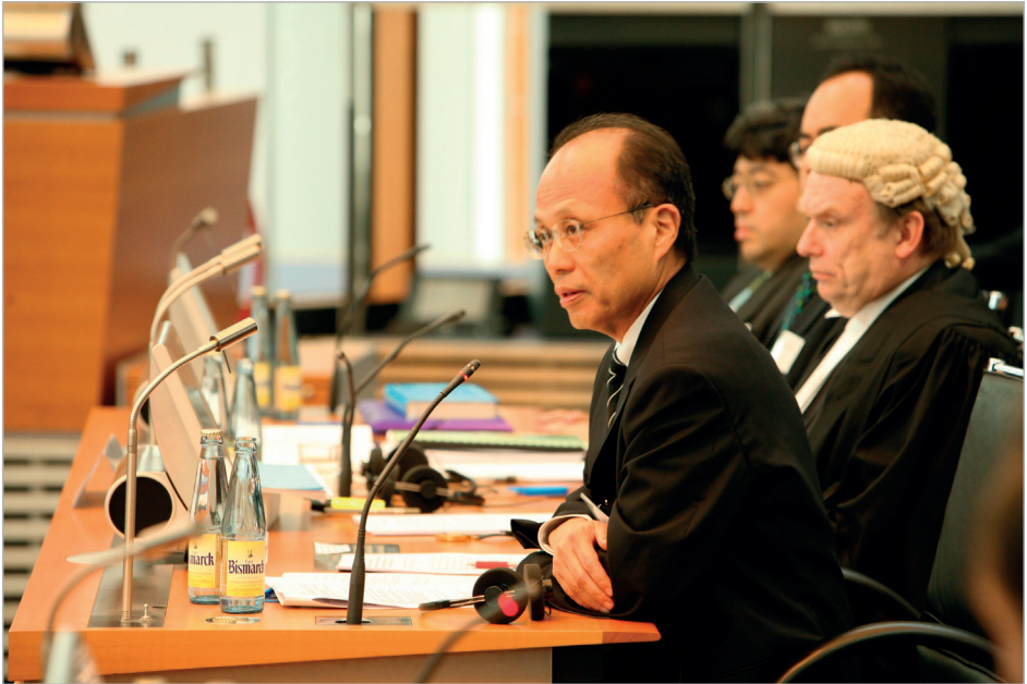
Affaire du « Hoshinmaru » (Japon c. Fédération de Russie), prompte mainlevée