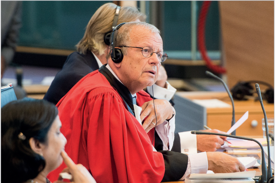
L'incident de l'« Enrica Lexie » (Italie c. Inde), mesures conservatoires