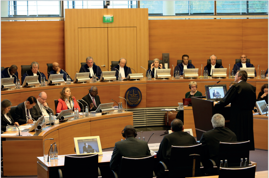
Affaire du navire « Virginia G » (Panama/Guinée-Bissau)