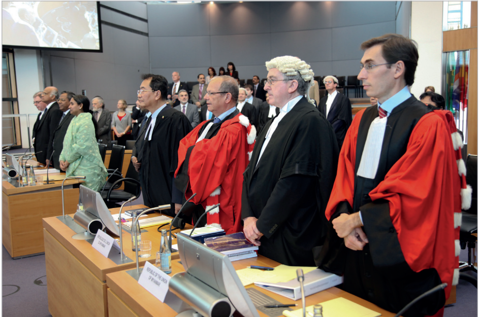
Différend relatif à la délimitation de la frontière maritime entre le Bangladesh et le Myanmar dans le golfe du Bengale (Bangladesh/Myanmar)